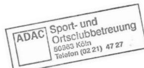
ADAC Nordrhein Sport und Ortsclubbetreuung Stempel