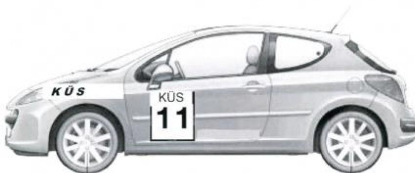
Fahrzeugseiten (links und rechts) Startnummernmatten, Startnummern, Werbematten

bitte vor der technischen Abnahme alle Aufkleber an die richtige Stelle kleben